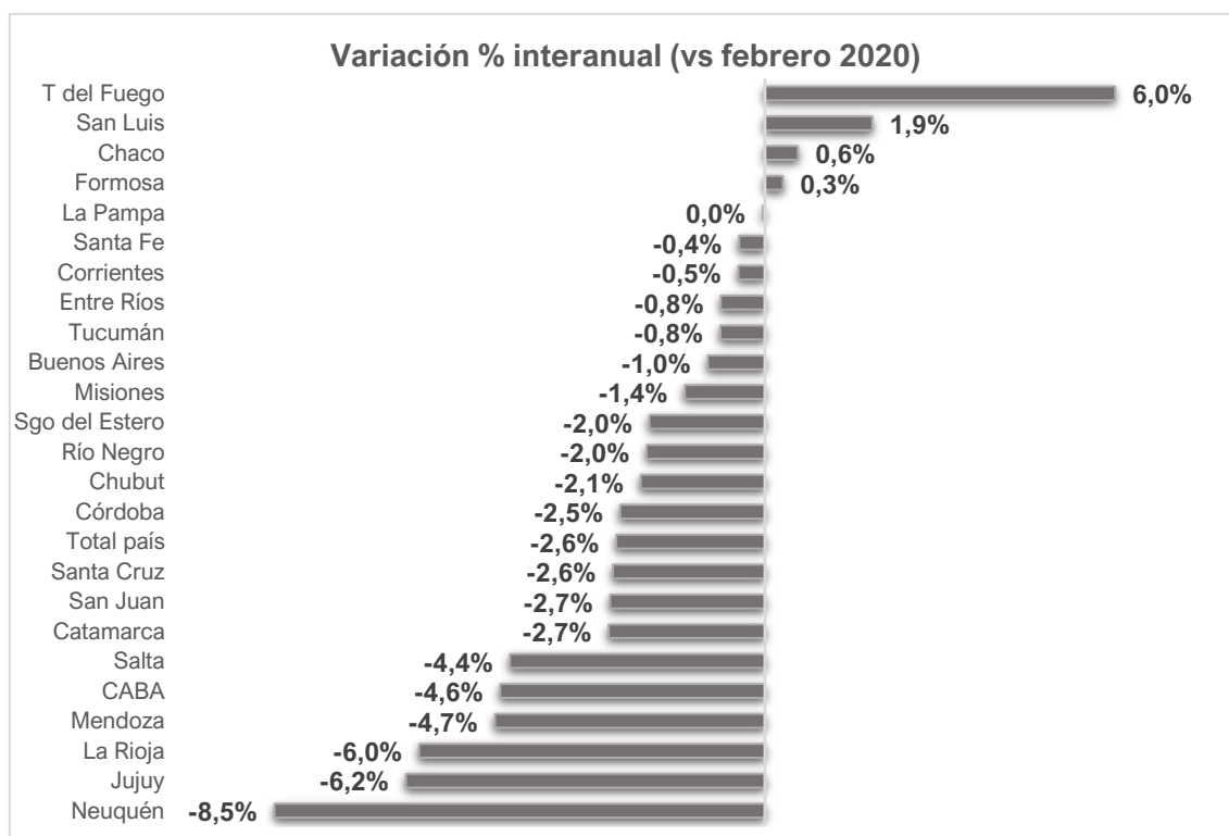
Gráfico 3. Serie original. Variación % interanual de febrero 2021. 24 jurisdicciones.